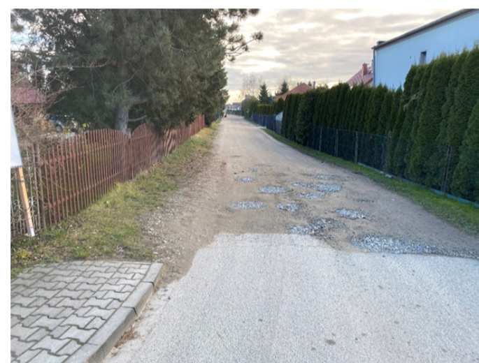
■ Rogów Sobócki ul. Słoneczna