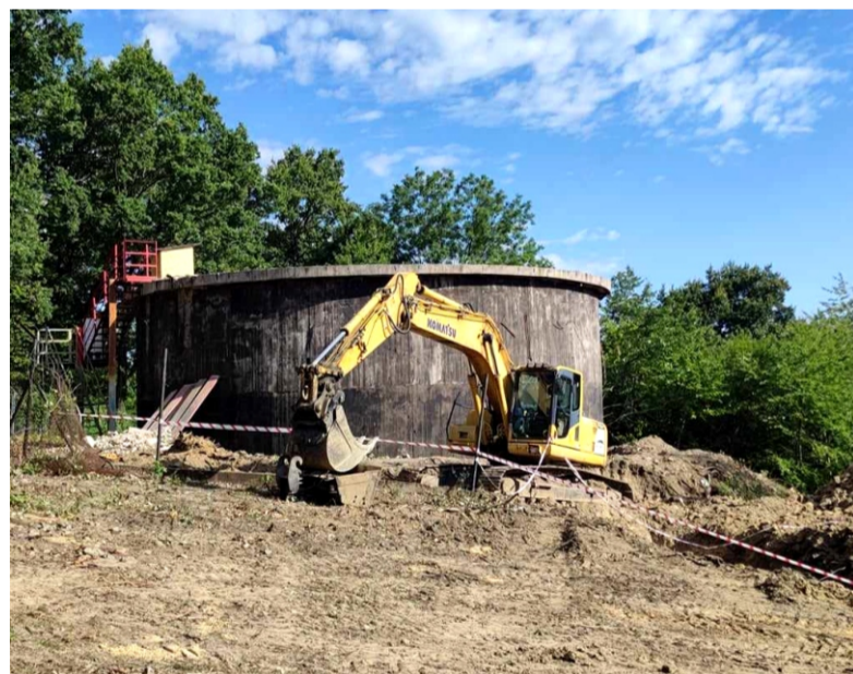
■ Stary zbiornik na wodę w Sobótce

Czysta woda to niezwykle cenny zasób naturalny, który stanowi fundament zdrowia ludzi i ekosystemów. W ostatnich latach zwiększona świadomość ekologiczna społeczeństwa sprawiła, że zagadnienia związane z jakością wody nabierają szczególnego znaczenia. Gmina Sobótka podejmuje aktywne działania w kierunku ochrony i poprawy jakości swojego zasobu wodnego. W ostatnich latach Sobótka, podobnie jak wiele innych miast w Polsce, zmagająca się z problemami związanymi z dostawami wody. Stare rury przesyłowe, pochodzące jeszcze z ubiegłego wieku, nie tylko powodowały liczne awarie, ale były także źródłem znaczących strat wody. Inwestycja w nowy wodociąg to nie tylko kwestia techniczna. To przede wszystkim inwestycja w przyszłość Sobótki, w komfort i bezpieczeństwo jej mieszkańców. Woda to źródło życia i nie możemy sobie pozwolić na jej marnotrawienie.