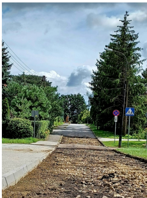
■ Sobótka ul. Turystyczna w trakcie układania nowej nawierzchni