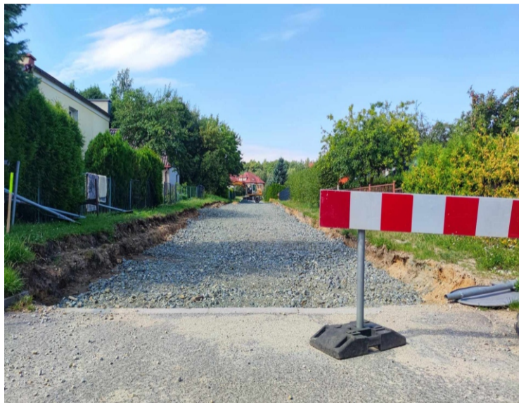
■ Sobótka ul. Chabrowa w trakcie wykonywania podbudowy