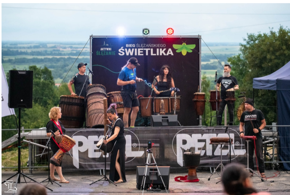
Koncerty na Biegu Świetlika