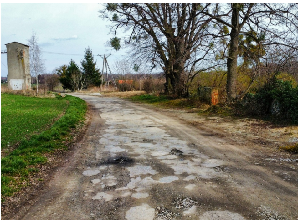
■ Księginice Małe, droga przed remontem