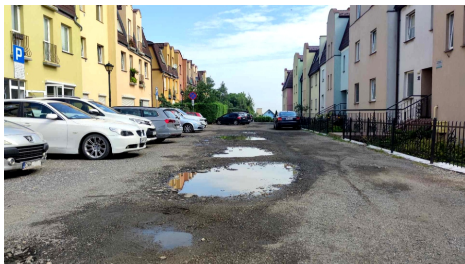
■ Sobótka ul. Ciasna - do planowanej przebudowy

Przy ogromnej dumie i satysfakcji chciałbym podzielić się z Państwem informacją dotyczącą naszej wspólnej przyszłości, która z każdym dniem staje się coraz bardziej realna i konkretna. Mowa o remontach i budowie nowych dróg na terenie naszej gminy.