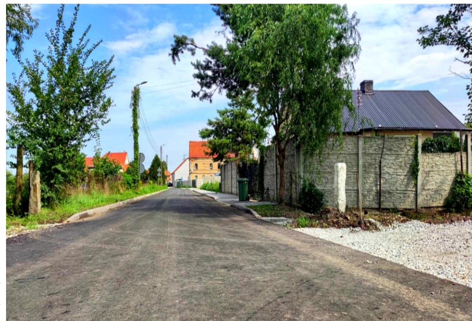
■ Olbrachtowice ul. Orla po przebudowie