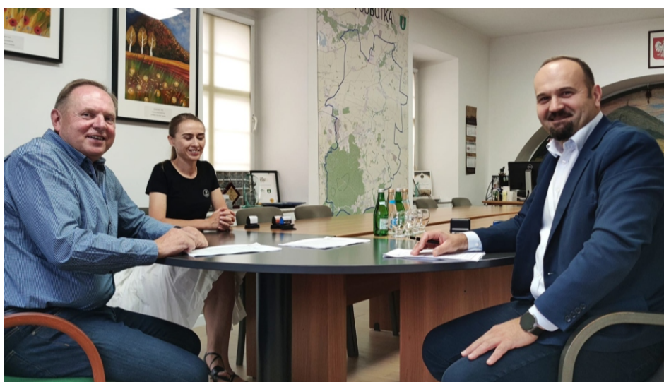
■ Podpisanie umowy na przebudowę ul.Przysiółkowej w Mirosławicach