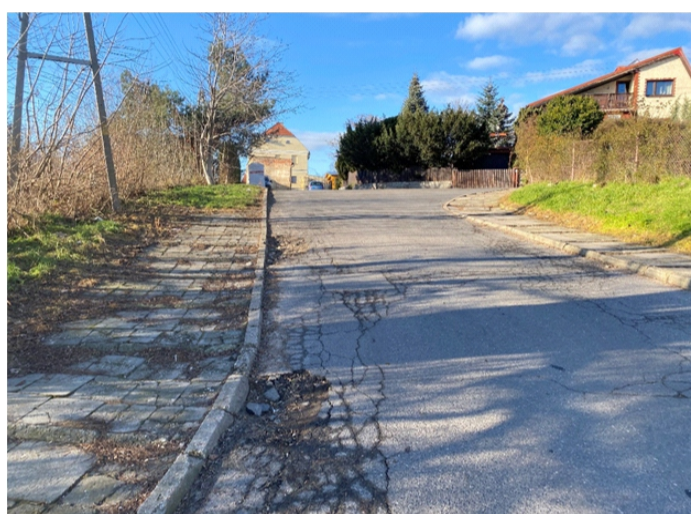
■ Sobótka ul. Parkowa - do planowanej przebudowy

Proszę o wyrozumiałość i cierpliwość. Wierzę, że efekt końcowy będzie wart tych chwilowych niedogodności. Pragnę podziękować wszystkim, którzy