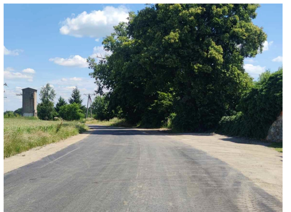
■ Księginice Małe, droga po przebudowie