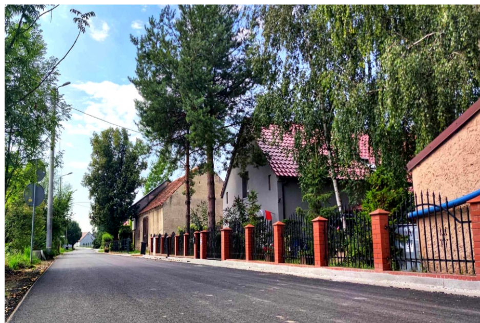
■ Ręków ul. Nasławicka po przebudowie