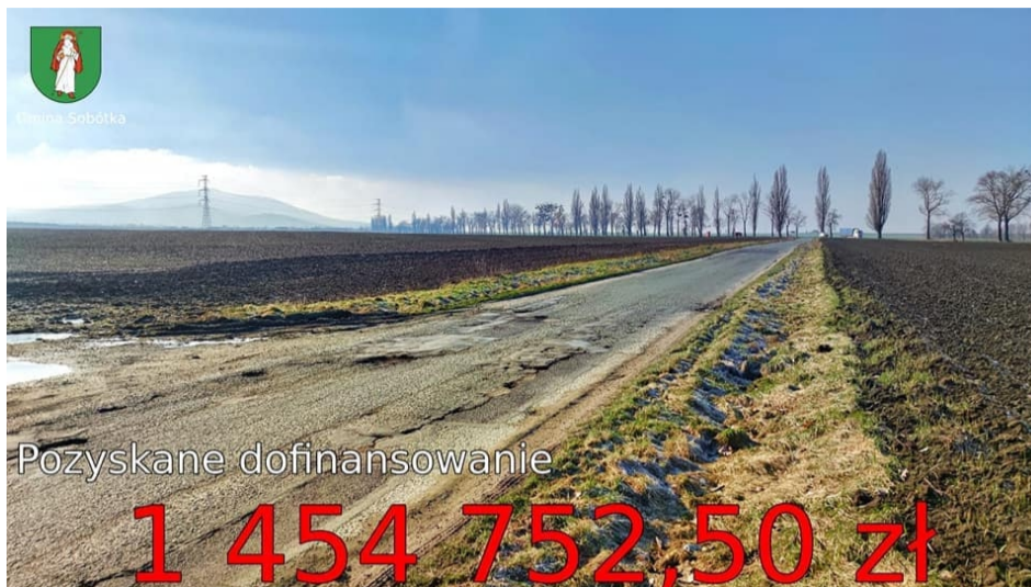
■ Mirosławice ul.Przysiółkowa przed przebudową

Obecnie trwają prace projektowe dla pierwszego etapu. Wykonawca również rozpoczął roboty na drugim etapie. Wykonano korytowanie pod jezdnię, wytyczono krawężniki, trwa układanie podbudowy. Wykonawca planuje zakończyć ten etap do końca roku.