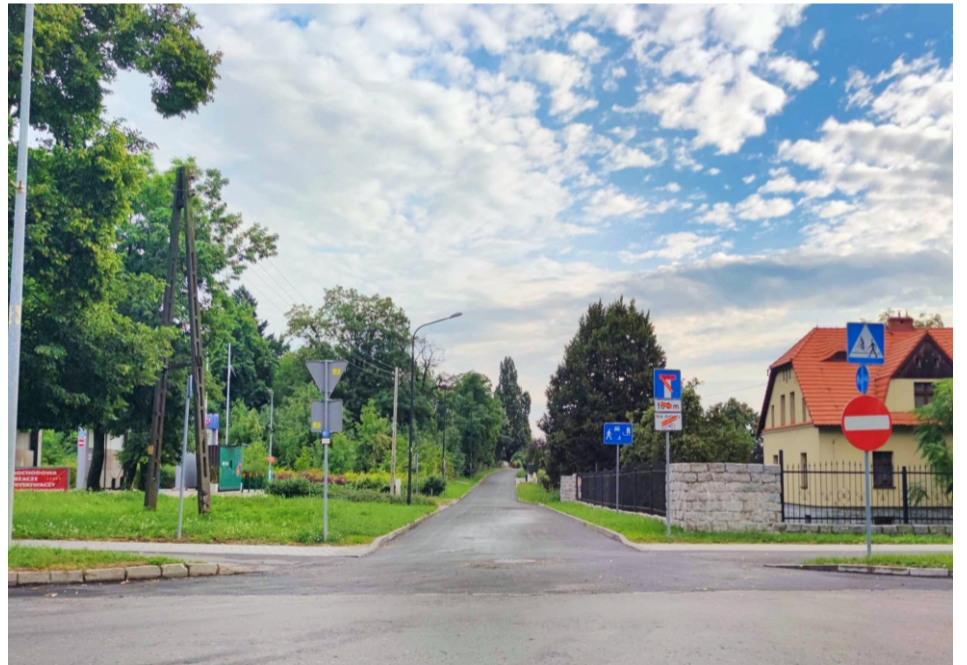
■ Sobótka ul. Turystyczna po przebudowie