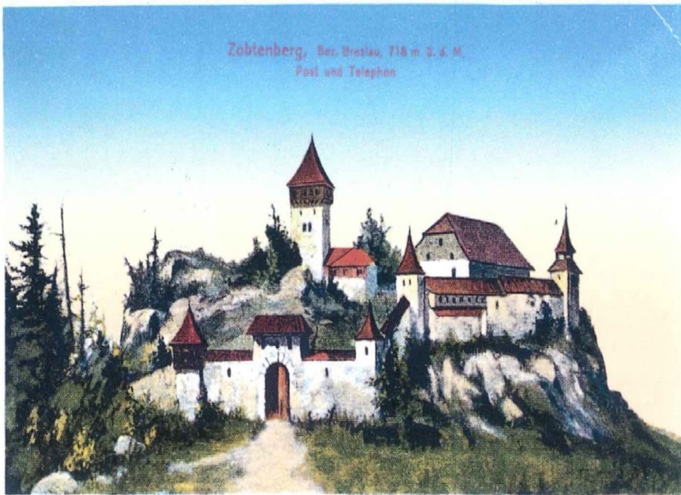
Die Sobottenburg auf dem Zobtenberge, welche bis zum Jahre 1471 an der Stelle der Berg-Kapelle gestanden hat.

Schronisko turystyczne według najnowocześniejszych wymogów i nowoczesnie wyposażone zaistniało w 1908 roku. Haase przewidywał, że na tłumnie odwiedzanej Śleży będzie mógł częstować turystów produkowanym przez siebie piwem. Nowe schronisko zachowało się do dzisiaj i dobrze świadczy o ówczesnych gustach architektonicznych. Powstał obiekt murowany, nakryty stromym dachem o zróżnicowanych formach i niejednakowej wysokości. Wnętrze mieściło dużą salę jadalną, bufet i kilka wygodnie urządzonej pokoi noclegowych. Przedmiotem szczególnym była salka Towarzystwa Śląskiego, znajdująca się w skrzydle północnym. Wystrój tego pomieszczenia był wyjątkowo urozmaicony i bogaty, a jednocześnie jednolity stylistycznie. Składały się na nie zdobione płaskorzeźbami dębowe boazerie i meble, artystycznie kute żyrandole, okucia i wieszaki, witraże w oknach i trofea myśliwskie rozwieszane na ścianach. Meble pod względem konstrukcji i formy wzo-