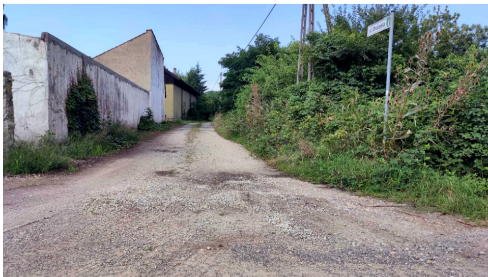
■ Nasławice ul. Drukarska przed przebudową

Kompleksowa budowa nowych ulic pozwoli na bezpieczną komunikację i drogę do szkoły dzieci z Sobótki Zachodniej. To kolejna część miasta, która zmienia się nie do poznania.