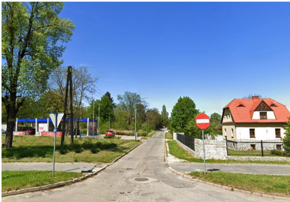
■ Sobótka ul. Turystyczna przed remontem