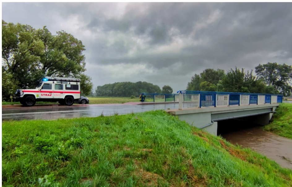
■ Kontrola poziomu wody i stanu wałów przez OSP w Sobótce

Wspólnie z Panem Wójtem Gminy Marcinowice Stanisławem Leń podjęliśmy działania dotyczące budowy zbiornika retencyjnego - przeciwpowodziowego na rzece Czarna Woda.