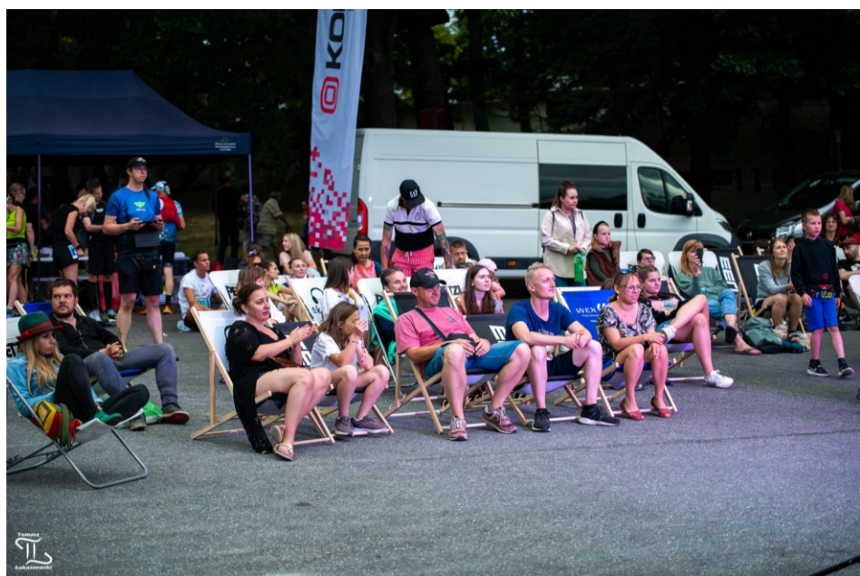
Kibice po Biegu Świetlika